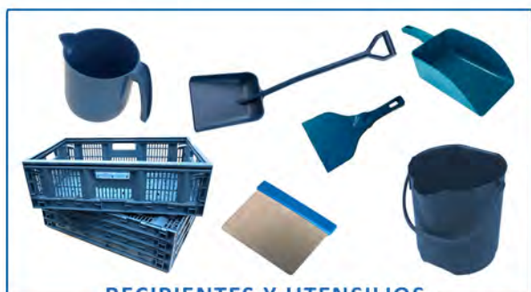
RECIPIENTES Y UTENSILIOS