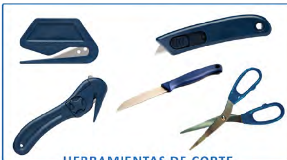
HERRAMIENTAS DE CORTE