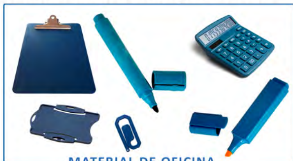
MATERIAL DE OFICINA

Ponemos a su disposición la más amplia gama de artículos detectables. Disponemos de Rotuladores, Portafolios, Cúters, Tijeras, Tiritas, Guantes, Cofias, Cubrebarbas, Cepillos y Escobas, Bridas, Pinzas, Jarras, Palas, Cubos, Rasquetas, Tapones y un largo etcétera.