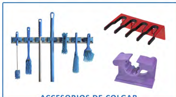
ACCESORIOS DE COLGAR